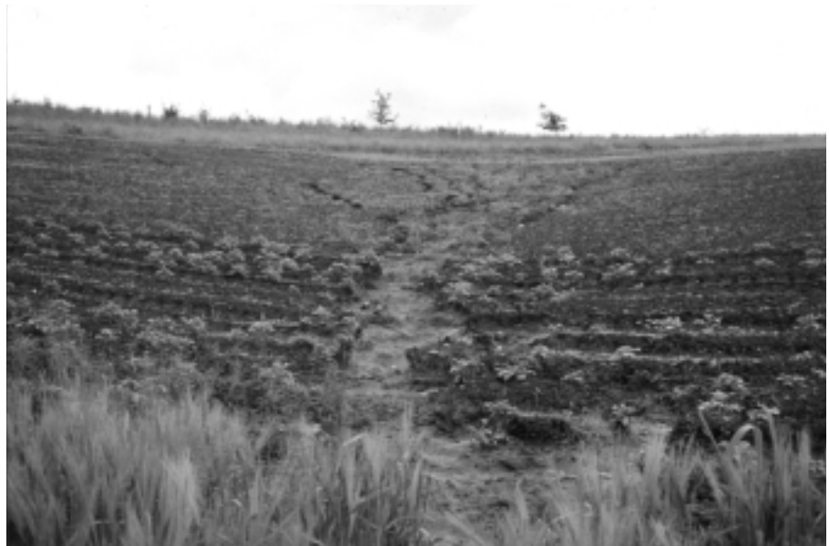
Hier hat nicht einmal die hangparallele Bearbeitung geholfen. Das Wasser sammelte sich zwischen den Kartoffelreihen und brach in der Tiefenlinie durch. Ein typischer Fall von Talwegerosion.

Bodenerosion richtet sowohl kurzfristige wie langfristige Schäden an, lokal auf der betroffenen Ackerparzelle aber auch in der näheren und weiteren Umgebung. Neben den augenfälligen Schäden an den Kulturen, denen oft buchstäblich «der Boden unter den Füßen» weggezogen wird, oder die in der abgelagerten Feinerde ersticken, sind auch die Kosten für die Reinigung von Flurstrassen und Kanalisation nicht zu unterschätzen. Etwa 10 bis 20 Prozent der abgetragenen Feinerde werden in die Oberflächengewässer gespült und gehen der Landwirtschaft so unwiederbringlich verloren. Doch nicht nur das: An den abgeschwemmten Bodenpartikeln haften Pflanzennährstoffe (vor allem Phosphor) und Pflanzenschutzmit-