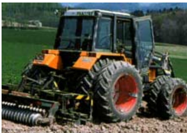
Abb. 8: Doppelbereifung.

Mit Gründüngung, Mist und Kompost den Humusgehalt und damit die Stabilität der Bodenstruktur erhöhen. Bei tiefem Boden-pH unterstützt eine Aufkalkung die Strukturbildung.