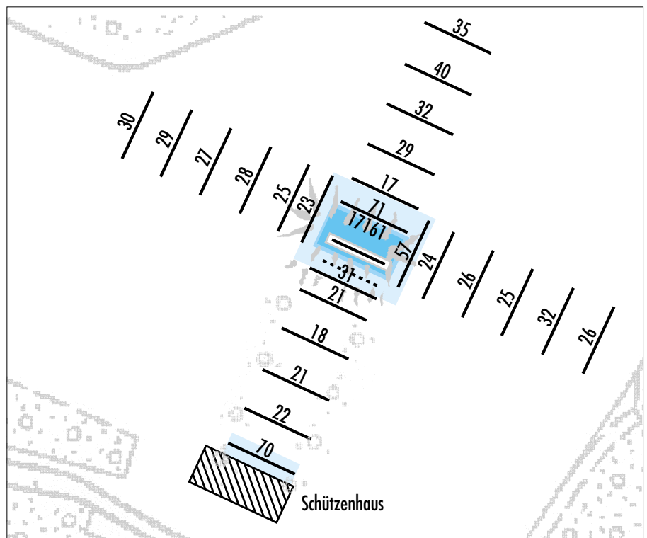
Gegenüberstellung der Bodenbelastungsverhältnisse bei unterschiedlich genutzten Schiessanlagen. Oben eine 50-m-Anlage, die seit 1923 in Betrieb steht bei einer durchschnittlichen Schusszahl von 25 000 pro Jahr. Unten eine seit 1973 betriebene 50-m-Anlage mit einer durchschnittlichen jährlichen Schusszahl von 3 500.